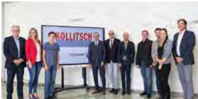
Vorbildlich: Die Zusammenarbeit zwischen Schule und Wirtschaft

1 Techn. Projektmitarbeiter/in (Ing.) (10573026): Laufende od. abgeschl. Ausbildung (HAK, HTL, FH oder Universität) od. Berufserfahrung im Webumfeld, Grundkenntnisse in HTML, CSS und JS, Arbeitsort: Wolfsberg, Mindestentgelt: € 26.000 bto/Jahr, AMS Wolfsberg , Tel.: 04352/52281